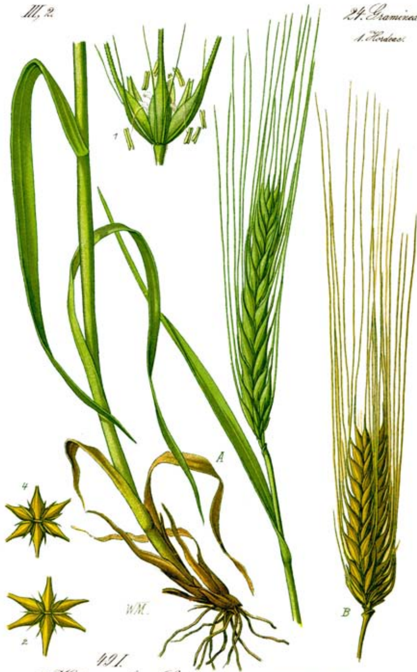
421. A. Hordeum vulgare L. B. Hordeum hexastichon L.